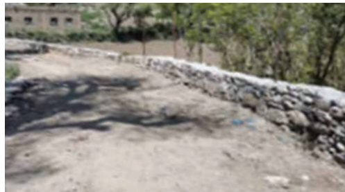
شق وبناء جدران سائدة ل طريق عريكة عزلة حصبان اسفل - مديرية المسراخ