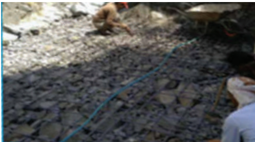
رصف وبناء جدران ل طريق خريشة عزلة خريشة - مديرية المسراخ