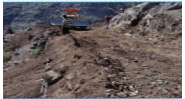
شق طريق وادي الانجد ريمة - عزلة بلاد الوافي مديرية جبل حبشي