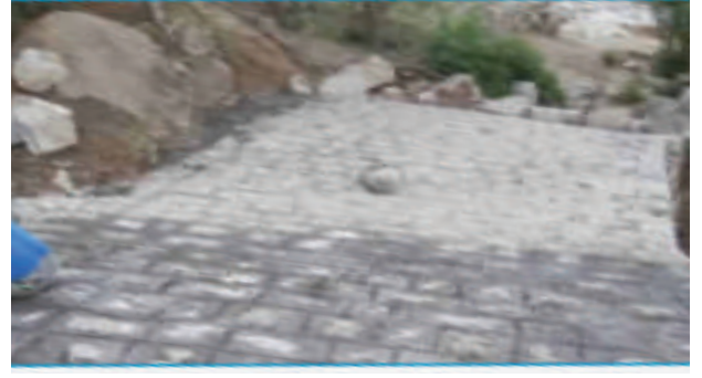
مشروع شق ورصف وبناء جدران سانده طريق عدينة - الجرف