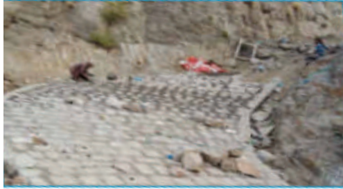
رصف وبناء جدران سائدة طريق الجندين المسنيفة عزلة بني عيسى - مديرية جبل حبشي