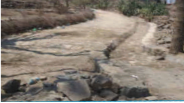
رصف طريق عمار الحوجية النوازل عزلة القحاف - مديرية جبل حبشي