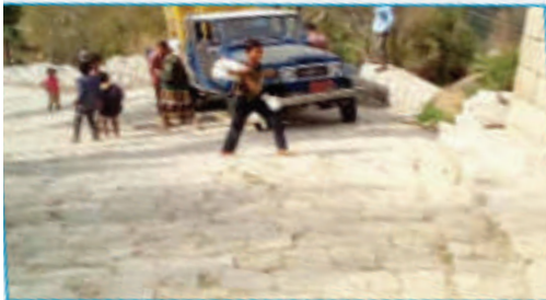
مشروع شق ورصق وبناء جدران سائدة طريق عدينة - الجرف