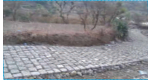
رصف طريق السندات - عزلة نمرة مديرية جبلا الحبشي